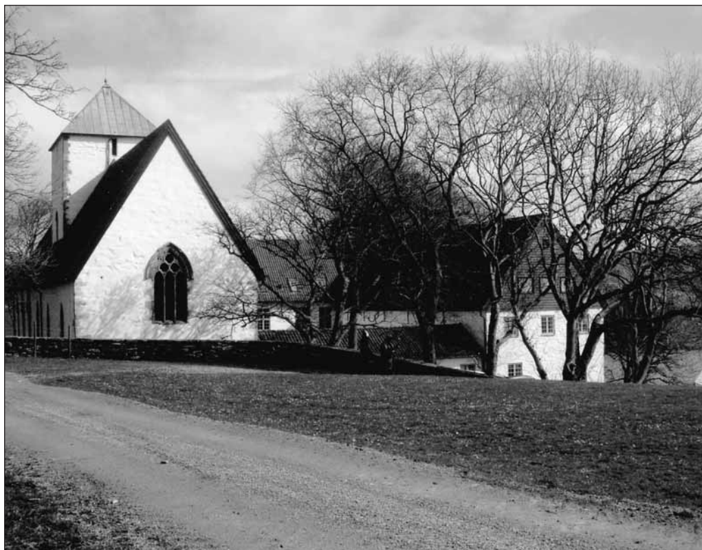
Utstein Kloster sett fra vest (Schanche-gården).