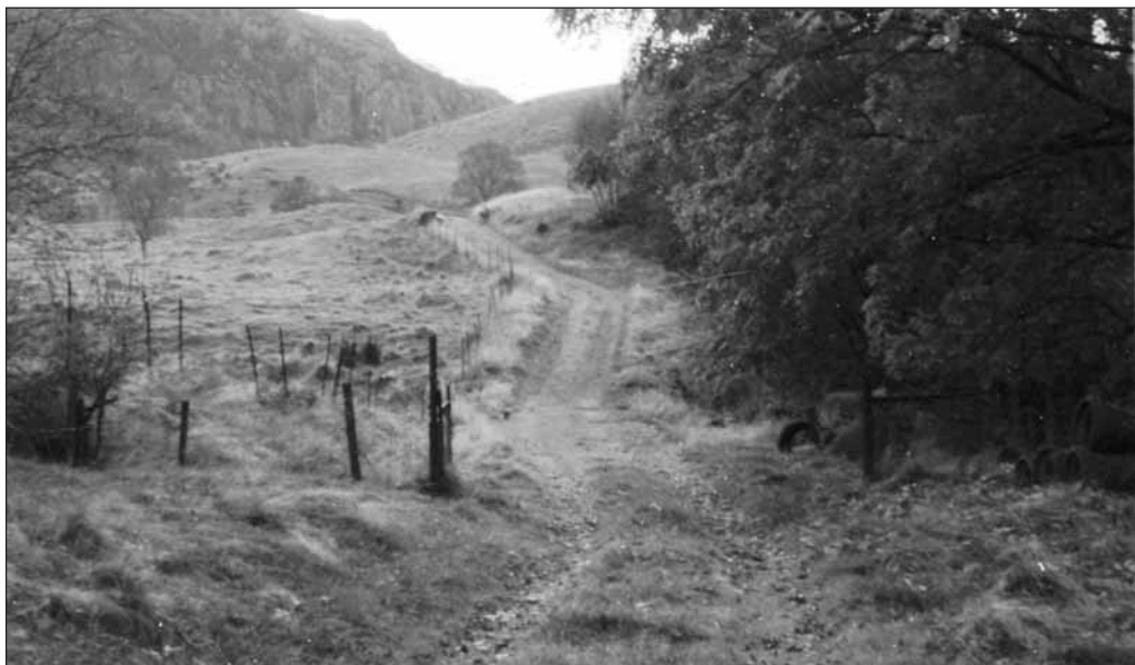
Postridevegen sett fra Håland i retning mot Øko-dalen og Risfjellet. Som ein ser er ikkje vege heilt snorbein i lendet, sjøl om han vart teikna opp med linjal. Fjellet til venstre i bakgrunnen er Håfjell.

Denne vege gjekk/går gjennom Møgedal sør for Åslandsnuten og Rossåsen og til Ålgård.